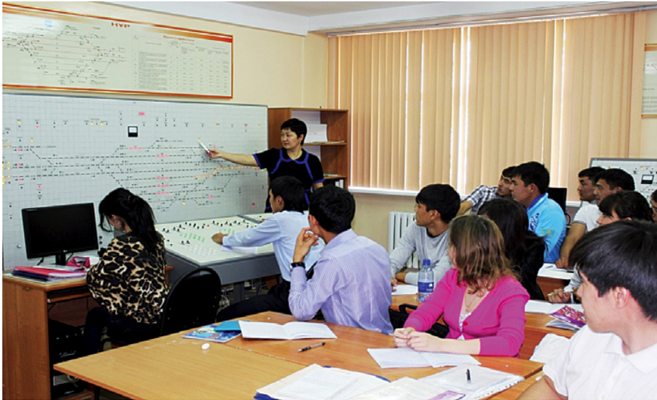
Лаборатория специальности «ОДУТИЛ», Прием и отправление поездов на участковых станциях