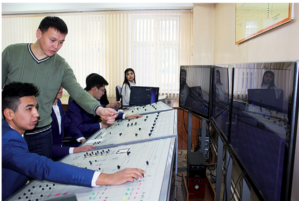
Лаборатория специальности «ОДУТиЛ», Сортировочная горка