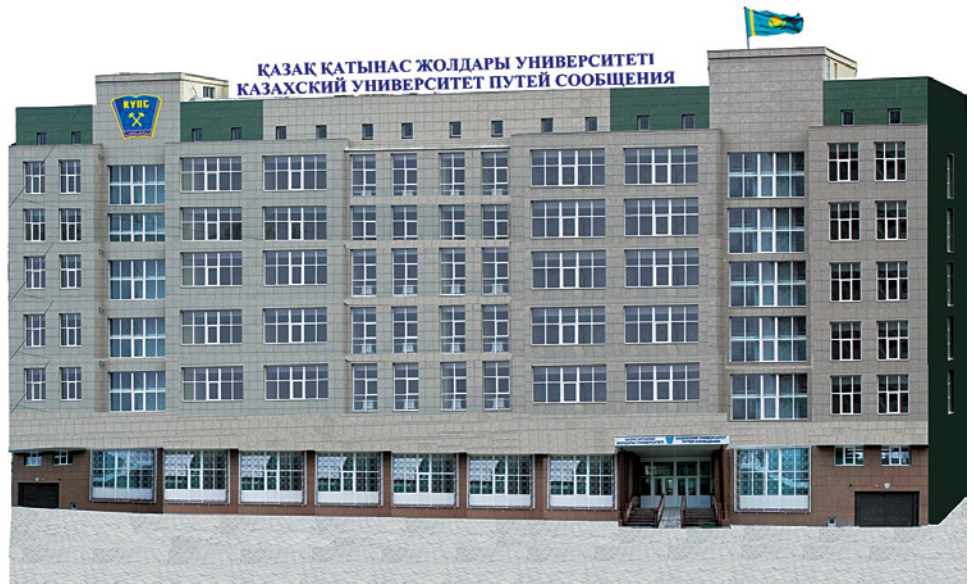
Корпус №1 (мкр. Жетысу-1, дом 32а)