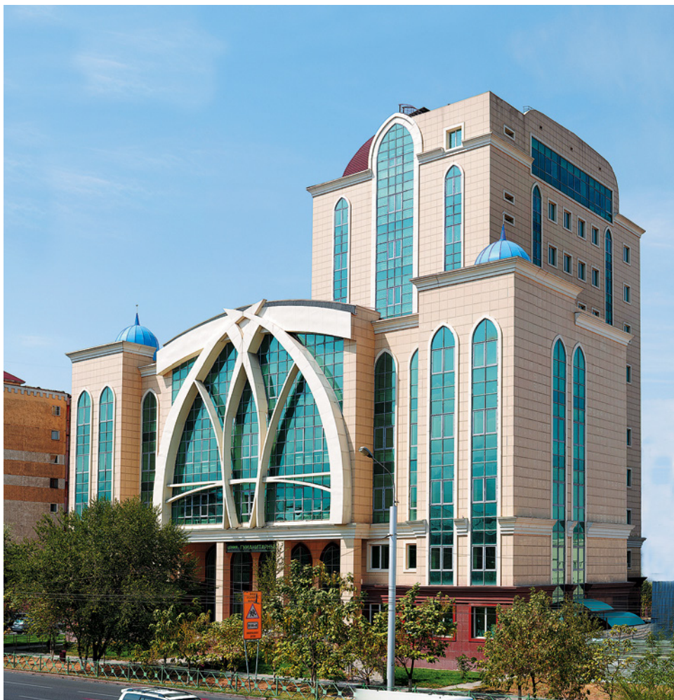
Корпус №4 (мкр. Мамыр-1, дом 21/1)

Университет имеет партнерские отношения, в общей сложности, с тридцатью зарубежными вузами, среди которых такие высшие учебные заведения, как Транспортный университет Чун Цин (КНР), Технический университет г. Варна (Болгария), Люблинский технический университет (Польша), Технический университет прикладных наук в г. Вилдау (Германия), Московский государственный технический университет им. Н.Э. Баумана, Санкт-Петербургский государственный университет телекоммуникаций им. М.А. Бонч-Бруевича, Московский государственный университет путей сообщения (МИИТ), Петербургский государственный университет путей сообщения (ПГУПС), Сибирская государственная автомобильно-дорожная академия (СибАДИ), Ташкентский институт инженеров железнодорожного транспорта (ТашиИИТ), Кыргызский государственный университет строительства, транспорта и архитектуры (КГУСТА) и многие другие. В число направлений международного сотрудничества включаются обмен преподавателями, учеными и сотруд-