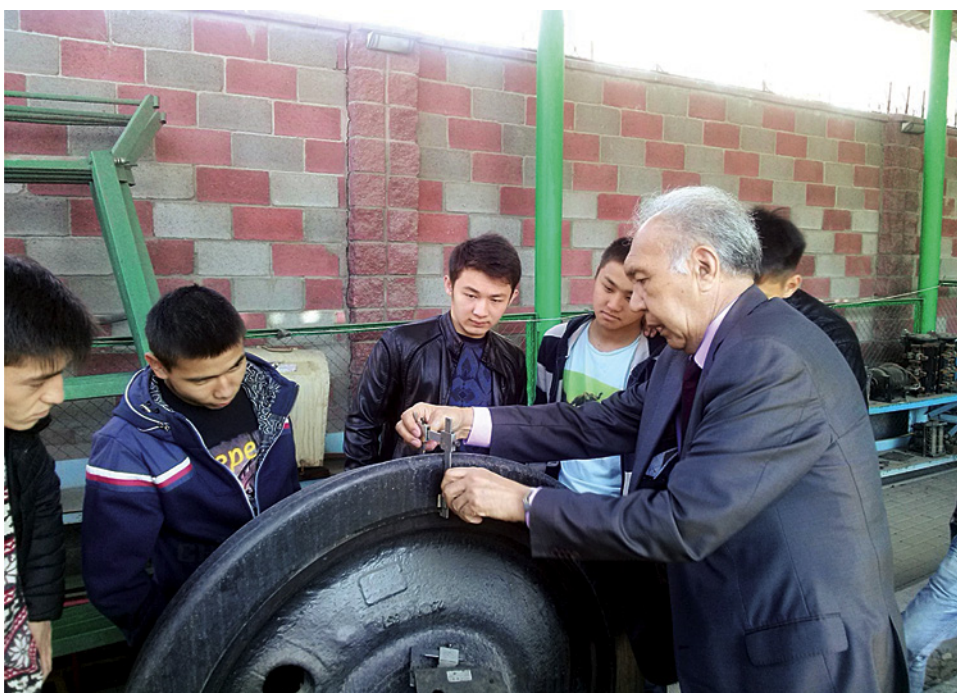
Проведение практических занятий по замеру колесных пар в железнодорожном полигоне

Справка: История Казахской академии транспорта и коммуникаций им. М. Тынышпаева началась с 1956 г., когда в Алматы был организован учебно-консультационный пункт Ташкентского института инженеров железнодорожного транспорта, в 1966 г. преобразованный в Алматинский филиал ТашИИТа. На базе филиала в 1975 г. был открыт первый транспортный вуз Казахстана – Алма-Атинский институт инженеров железнодорожного транспорта для подготовки специалистов для железнодорожного транспорта и транспортного строительства Казахстана.