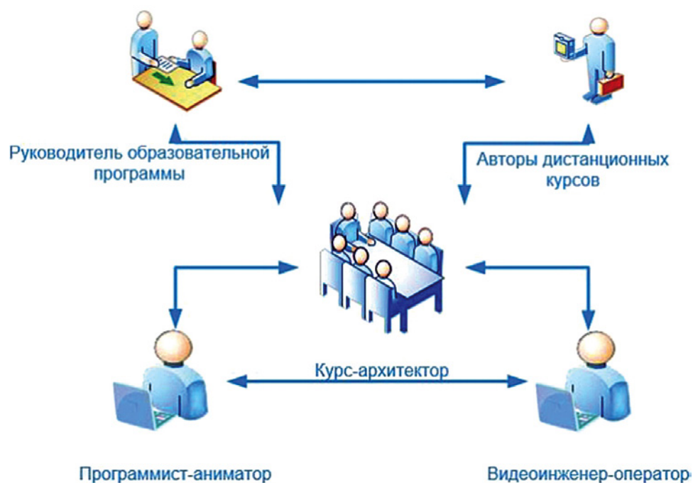
Диаграмма № 3. Команда по разработке авторских курсов

менно в аудиториях Анкары, Стамбула и Туркестана с предварительным контролем документов, удостоверяющих личность.