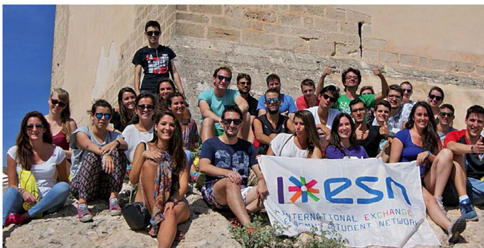
Экскурсия, организованная Международной организацией обмена студентов, Университет Аликанте, Испания