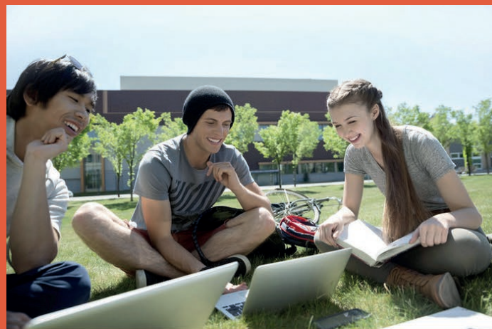
2021 ЖЫЛЫ ЖОО-ҒА ҚАЛАЙ ТҮСУҒЕ БОЛАДЫ? КАК ПОСТУПИТЬ В ВУЗ В 2021 ГОДУ?

– Для получения этой профессии вам нужно выбрать группу образовательных программ В057 «Информационные технологии». Программирование преподается в